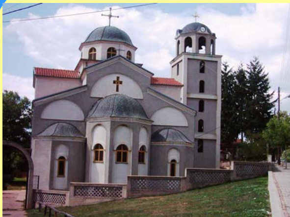
Црква Св.Петар и Павле