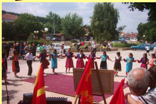
КУД Јане Сандански