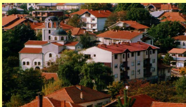
Летниковци Равна Река